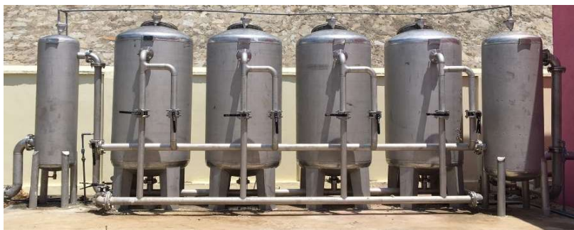
Hệ Lọc kín 30m 3 /h (Trạm CN xã Phước Bình- Bắc Ái- Ninh Thuận)