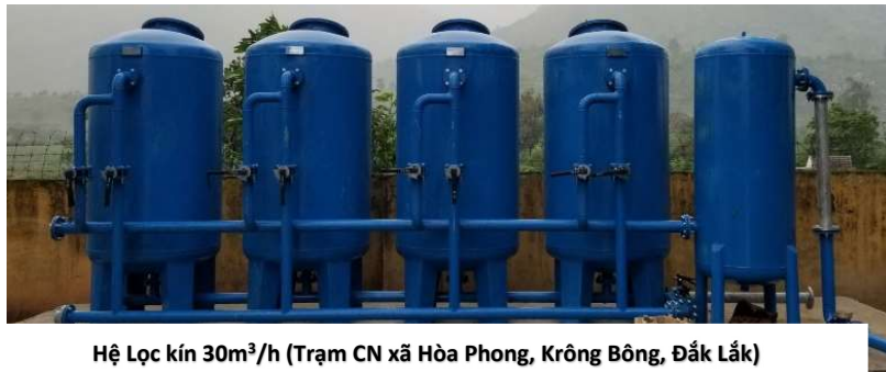
Hệ Lọc kín 30m 3 /h (Trạm CN xã Hòa Phong, Krông Bông, Đắk Lắk)