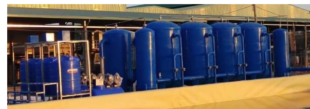
Hệ Lọc kín 140m 3 /h (Nhà máy Tinh bột sắn Vinata - Tân Biên, Tây Ninh)

----- RẤT MONG SỰ HỢP TÁC CÙNG VỚI QUÝ KHÁCH HÀNG -----