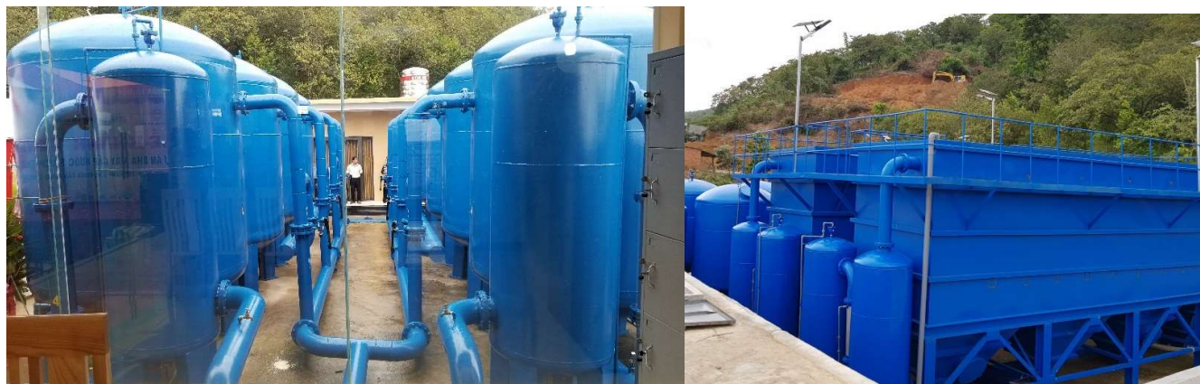
Hệ thống xử lý nước Lamella - Lọc kín 500m 3 /h (Nhà máy nước Thanh Sơn - Tân Phú - Đồng Nai)