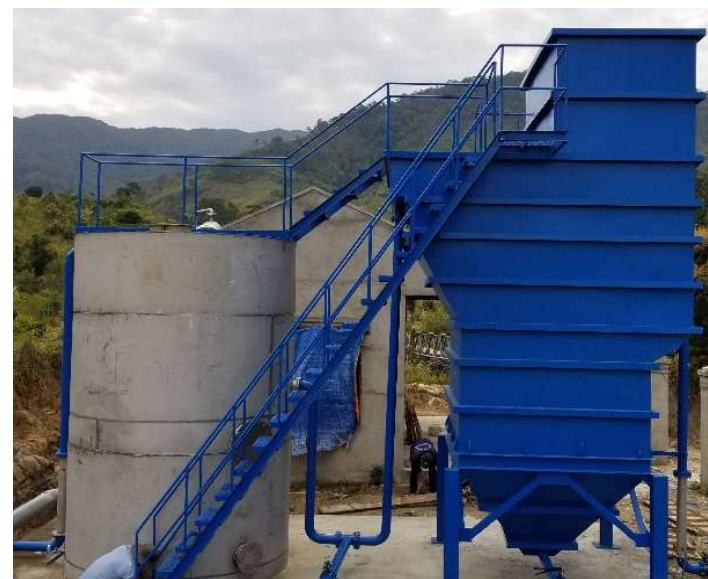
Hệ Lamella - Xiphong 30m 3 /h (Trạm CN Đam Rông - Lâm Đồng)