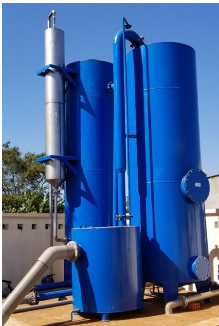
Hệ Lọc nổi - Xiphong 10m 3 /h (Trạm CN xã Bàu Cạn - Chư Prông- Gia Lai)